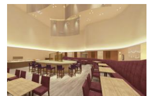
カフェ(ロビーフロア)

5階ロビーフロアにてカフェ(日本ホテル株直営)がオープン。朝早くから活動を始めるビジネス・レジャー利用のお客さまにもしっかりと朝食をとっていただけます。カフェタイムは、お勤めの方々のミーティングや地域の方々の憩いの場としてご利用いただけます。