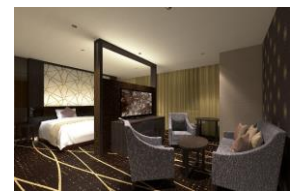
エグゼクティブツイン

客室は埼玉県木のけやきをモチーフにしたデザインが施され自然の安らぎを提供。全室ベッド・備品にこだわり、さらにワンランク上のエグゼクティブツインの客室は記念すべき日にご利用される方におすすめです。